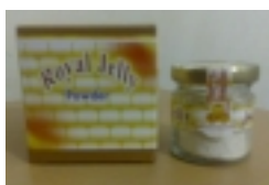
Royal Jelly Powder Al-Dahabiyah Rp. 33.500

fungsi organ tubuh, anti kanker, anti virus, menurunkan kolesterol, dan meningkatkan seksual pria, meremajakan kulit, menghilangkan kerut diwajah, awet muda dll. Royal Jelly mengandung protein antibakteri yang sangat kuat, oleh ilmuwan Jepang disebut royalisin. Royalisin ini kaya asam amino dan efektif khususnya untuk melawan bakteri Gram-positive termasuk di dalamnya staph dan strep species.